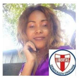
A cura della Dott.ssa CLEMENTINE HENRIETTE

yenny.gonzales@dconline.info) ha inteso formulare alla nuova Dirigente della D.C. in Turchia i più cordiali auguri di <Buon lavoro > e di < Buona D.C. >!